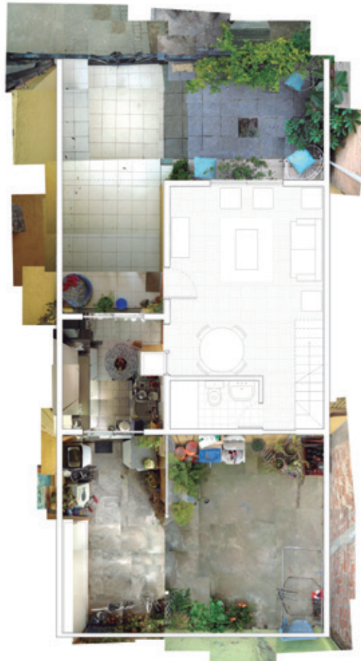
Fig. 01 Plano Fotográfico, Sección Inicial, Talca, 2020