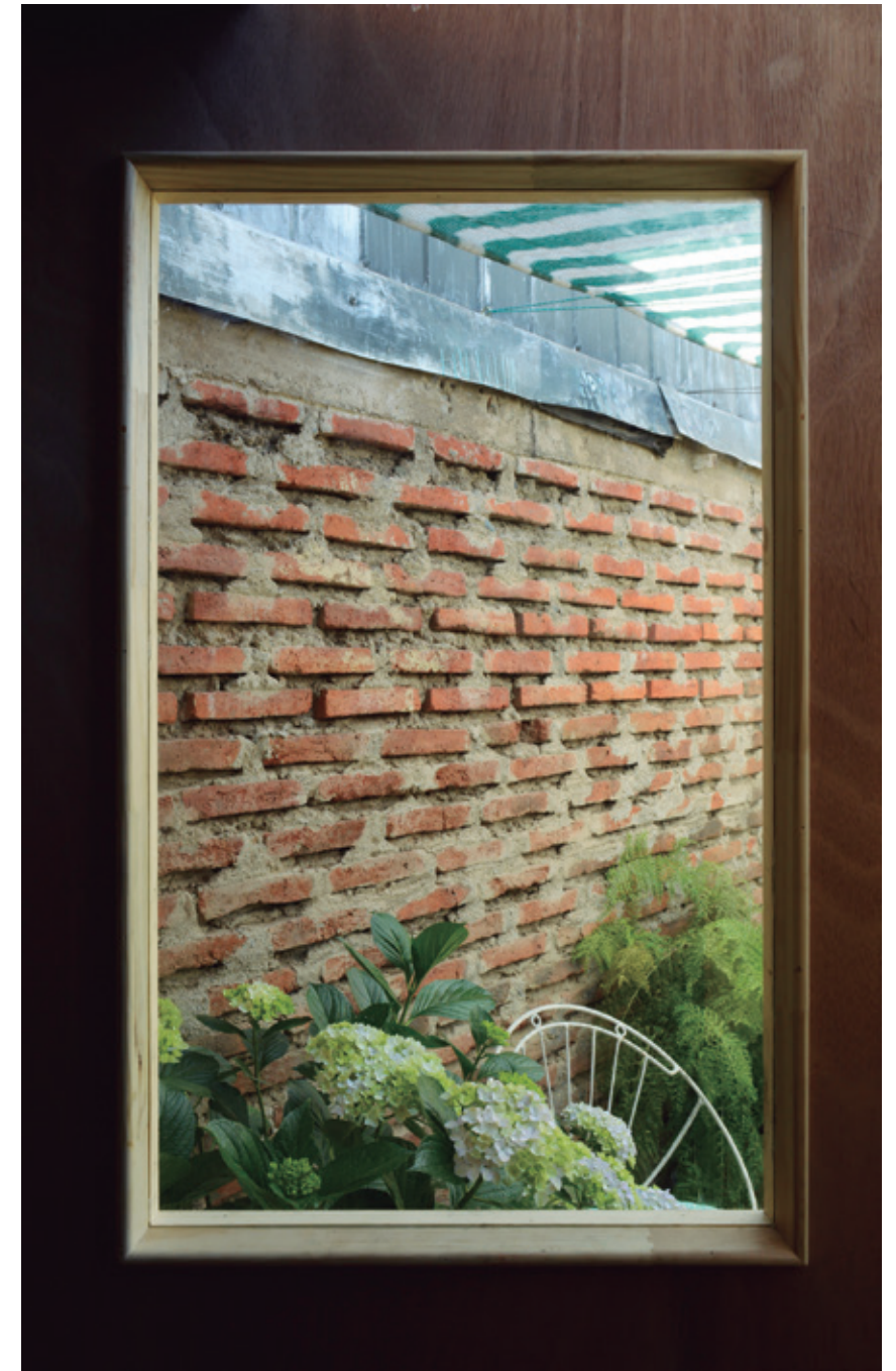
figura 2 Taller Intervenciones Domésticas Profesores: Germán Valenzuela, Felipe Miño Proyecto estudiante Nicolás Acuña

rita_16 noviembre 2021 ISSN: 2340-9711 e - ISSN 2386 - 7027 págs 56-63