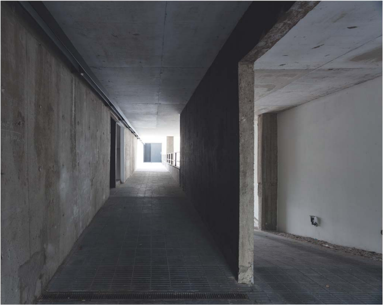
Vista desde el "túnel" de planta baja

Las viviendas Jufre son una investigación sobre las posibilidades surgidas al operar sobre las formas de habitar la ciudad al asociarse con el edificio vecino, propiedad de un amigo de confianza. En este juego de solares se demuestra que existen posibilidades originales de convivencia entre arquitecturas, a pesar de estar viviendo en un momento en el que las ciudades tienden a la densificación.