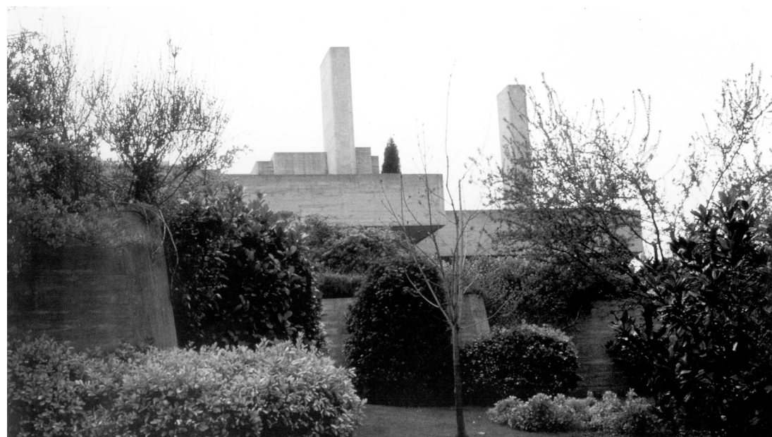
[6] La casa Valdecasas. (1990,)