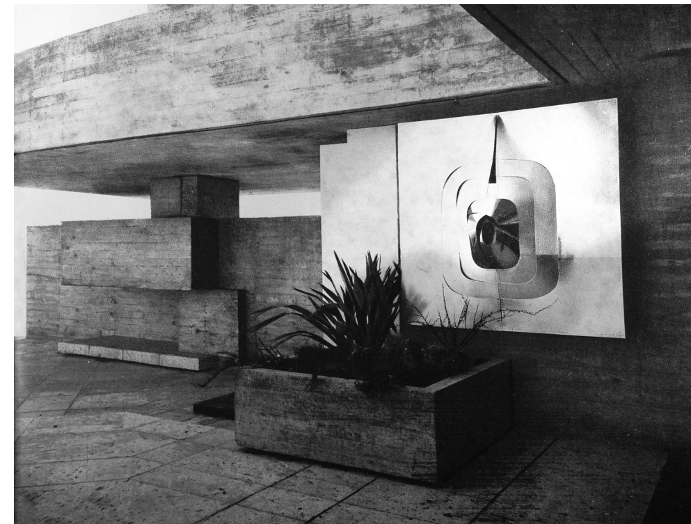
[1] Acceso a la casa Carvajal, La Madriguera , 1969, Carlos Saura. Cámara Luis Cuadrado.

italiano como la Nouvelle Vague acompañarán la crítica moral con una nueva estética; una nueva forma de narración de una realidad a descifrar, "con nexos deliberadamente débiles y acontecimientos flotantes" 3 siempre ambigua, donde interviene lo psicológico. Los signos no se supeditan al movimiento y cobran protagonismo los tiempos muertos, la imagen estática, prolongada, como mecanismo de profundización en el alma del personaje. Antonioni o Godard 4 utilizan la arquitectura moderna recurrentemente como estructura de este lenguaje de situaciones puramente ópticas, que busca un grado de abstracción en la descripción, frente a lo excesivamente obvio o axiomático. Si bien el mundo metafórico de Saura en La Madriguera se escapa de la visión distante, la lectura reflexiva de la imagen de Luis Cuadrado sigue la estela europea de establecer nuevas conexiones entre el hombre y el espacio.