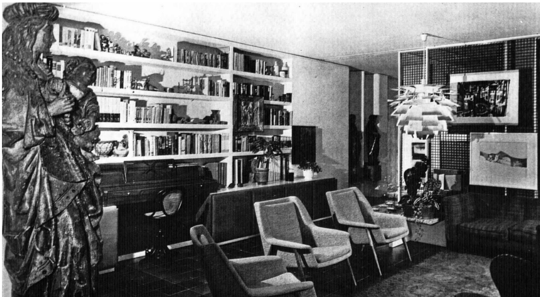
[4] Interior de la casa Carvajal, 1970, publicada en 1972 en Arte y Hogar n°320-321.

debe ver en su abstracción, la realidad que llegará a ser, y no solo elementos, sino también, texturas, materiales y colores".