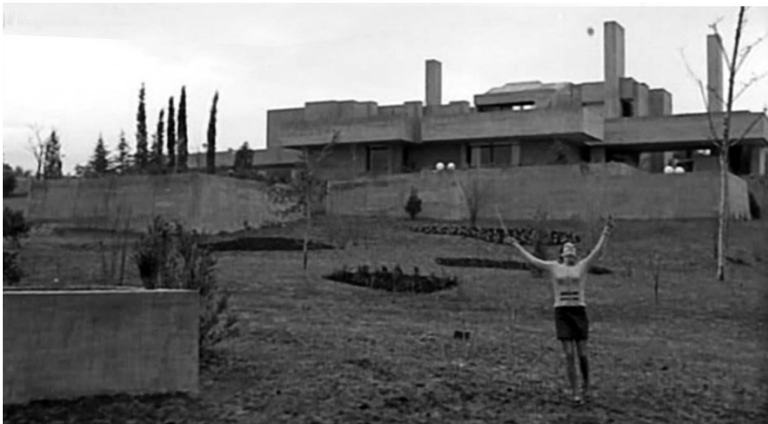
[5] La casa Valdecasas en La Madriguera . La Madriguera 1969, Carlos Saura. Cámara Luis Cuadrado.