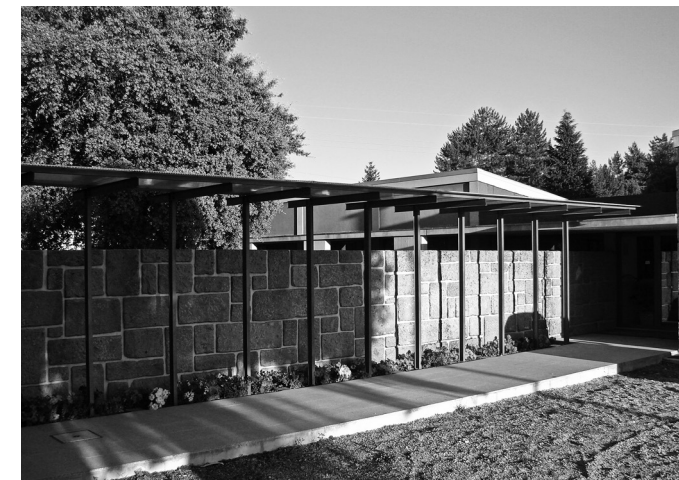
[8] Acceso cubierto al mercado de Picote.

ubicar servicios comunes y abrirse al paisaje. En sección, se revisitan los planteamientos de las escuelas Munkengard, (1937-38), con huecos rasgados bajo el desfase de las cubiertas.