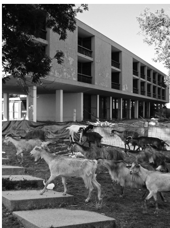
[4] Alzado sur de la Pousada de Picote, valiente modernidad rodeada de usos y hábitos tradicionales.