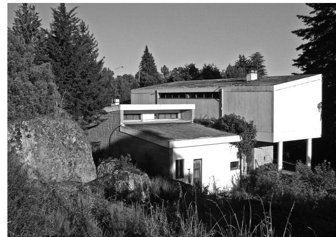
[7] Casa tipo para Ingenieros, en Picote.