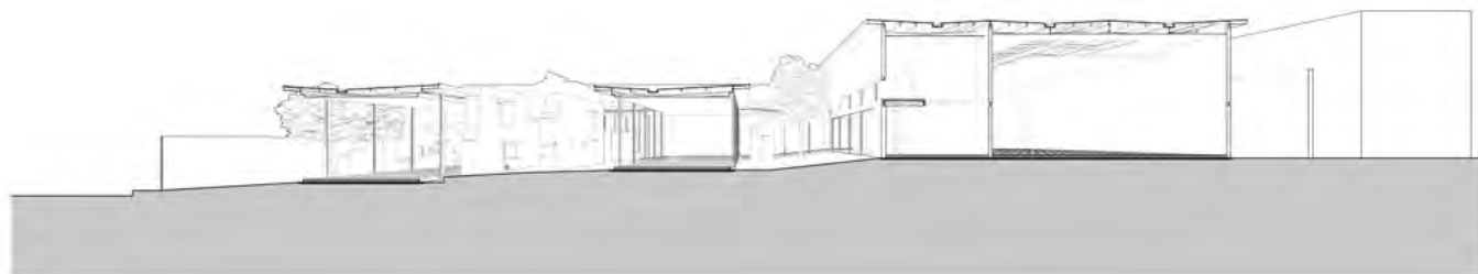
0 1 5 10 20m SECCIÓN LONGITUDINAL