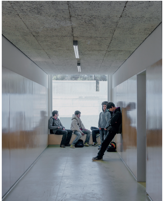
Densificar el conjunto, atribuir complejidad a la relación entre las partes; construir entre los pabellones espacios destinados a las actividades colectivas de la escuela.