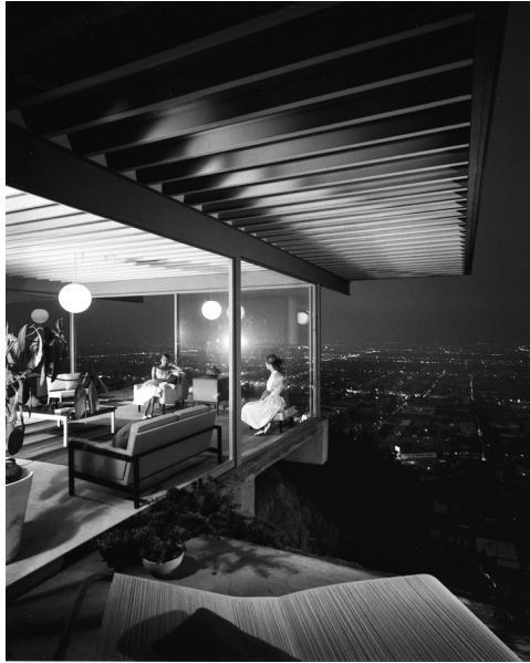
[5] Pierre Koenig, Case Study House número 21 en Los Angeles, California (1956-1958).