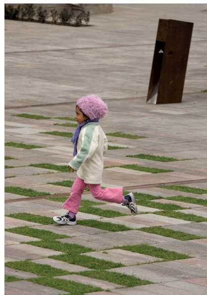
Lo fundamental era abrir el espacio para el uso público, con libre acceso a todo el predio, liberándolo de barreras arquitectónicas y construyendo espacios de encuentro y disfrute de la ciudad