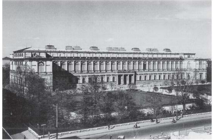
[1] Antigua Pinacoteca diseñada por Leo von Klenze antes de la destrucción. Fuente: Archivo de la „Bayerischen Staatsgemälde-Sammlung“ En: PETER, Franz; WIMMER, Franz. Von den Spuren: Interpretierender Wiederaufbau im Werk von Hans Döllgast . Salzburg-München: Anton Pustet, 1998.