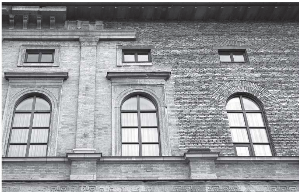
[6] Detalle de la consolidación de los restos de la envolvente de Klenze por Döllgast completando sillares dañados con fábrica de ladrillo y adosado de otros restos de la fábrica antigua a la nueva fábrica de Döllgast. Autor: Elena Zapatero Rodríguez.