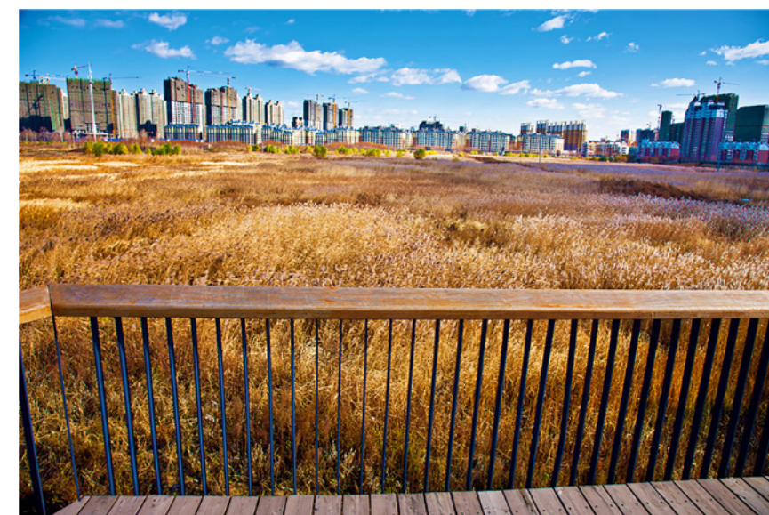
figura 5 Vista sobre el humedal desde una de las plataformas del recorrido. / Autor de la imagen: -. / Procedencia o referencia bibliográfica: https://www.turenscape.com/en/project/detail/4646.html . / Año de realización: 2017. / Datos del propietario: Turenscape.

Este perímetro actúa en términos equivalentes a la Buffer Zone de Bwindi: es una zona que separa la zona urbana del humedal, pero también es una zona de convivencia, el espacio al que llegan las aguas antes de ser distribuidas por el corazón del parque y el lugar que los seres humanos pueden recorrer para contemplar los procesos que se dan en un interior donde únicamente crece la vegetación que los recursos naturales de la zona garantizan. El humedal emerge no como un jardín cultivado, sino como un auténtico Edén, un espacio donde la naturaleza se muestra ajena a la tradición de la jardinería planificada por el ser humano.