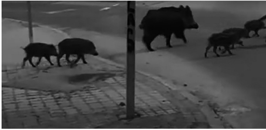
figura 8 Captura de imagen de un video donde aparece una piara de jabalíes que se pasca por la Ciudad Universitaria de Madrid el 11 de mayo de 2020. / Autor de la imagen: - / Procedencia o referencia bibliográfica: https://elpais.com/videos/2020-05-12/una-familia-de-jabalies-de-paseo-por-el-campus-universitario-de-madrid.html. / Año de realización: 2020.

dominaba un espacio que se elevaba ajeno al bullicio intensamente urbano de Manhattan. Pero en el momento en que se abre al público, el High Line es ocupado por millones de visitantes y esta afluencia masiva es incompatible con la presencia de una naturaleza espontánea. Ésta sobrevivía simplemente adaptándose a las condiciones climáticas de Nueva York cuando la presencia humana era muy reducida. Los pocos vecinos que se aventuraban sobre el High Line eran como el grupo de ocho turistas permitidos para visitar cada grupo de gorilas en Bwindi que, en principio, no distorsionan el carácter salvaje del Parque. Pero millones de visitantes sólo son posibles sobre una fantasía vegetal que recrea lo silvestre pero no sobre la auténtica naturaleza. La presencia humana –en la versión multitudinaria en la que hoy habitamos el mundo- es incompatible con esa naturaleza desarrollándose en todo su potencial. La antigua aspiración burguesa de reencuentro y fusión con la naturaleza no supo vislumbrar está contradicción, este conflicto entre naturaleza y condición humana.