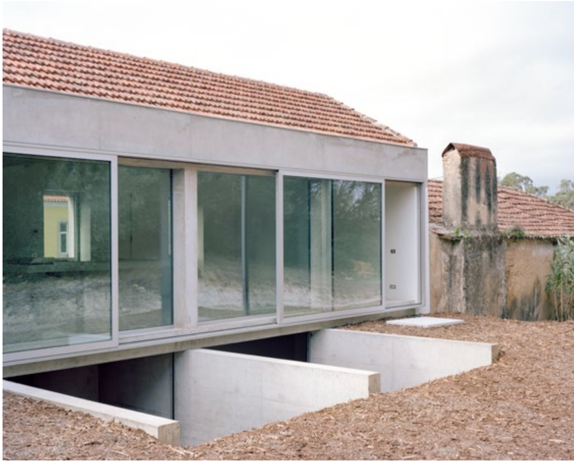
fotografias figura 6-11